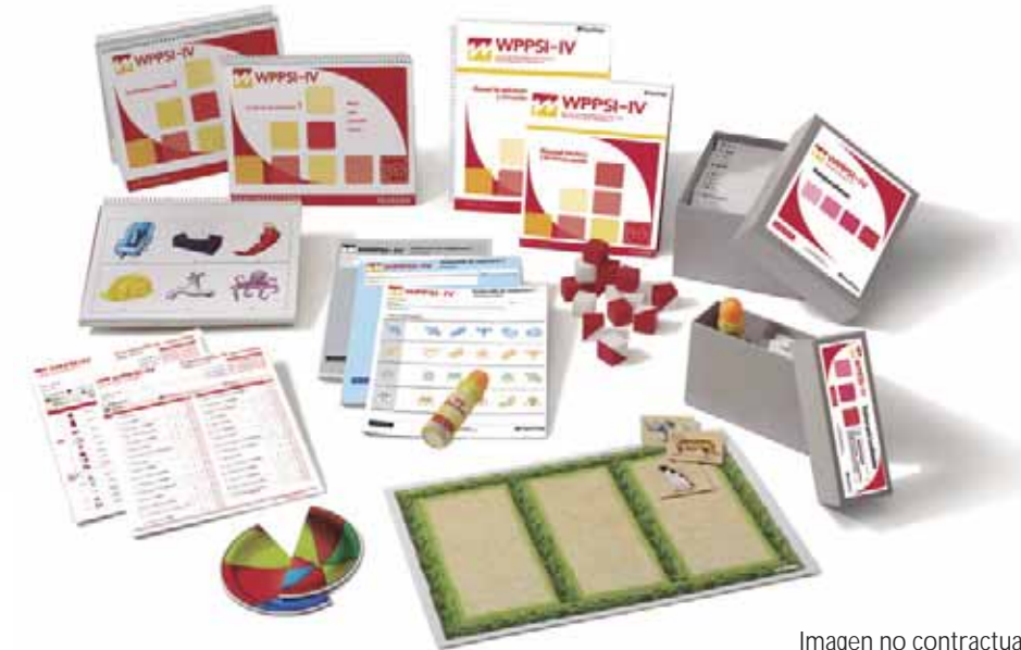
Imagen no contractual

! ADVERTENCIA: Contiene objetos pequeños.